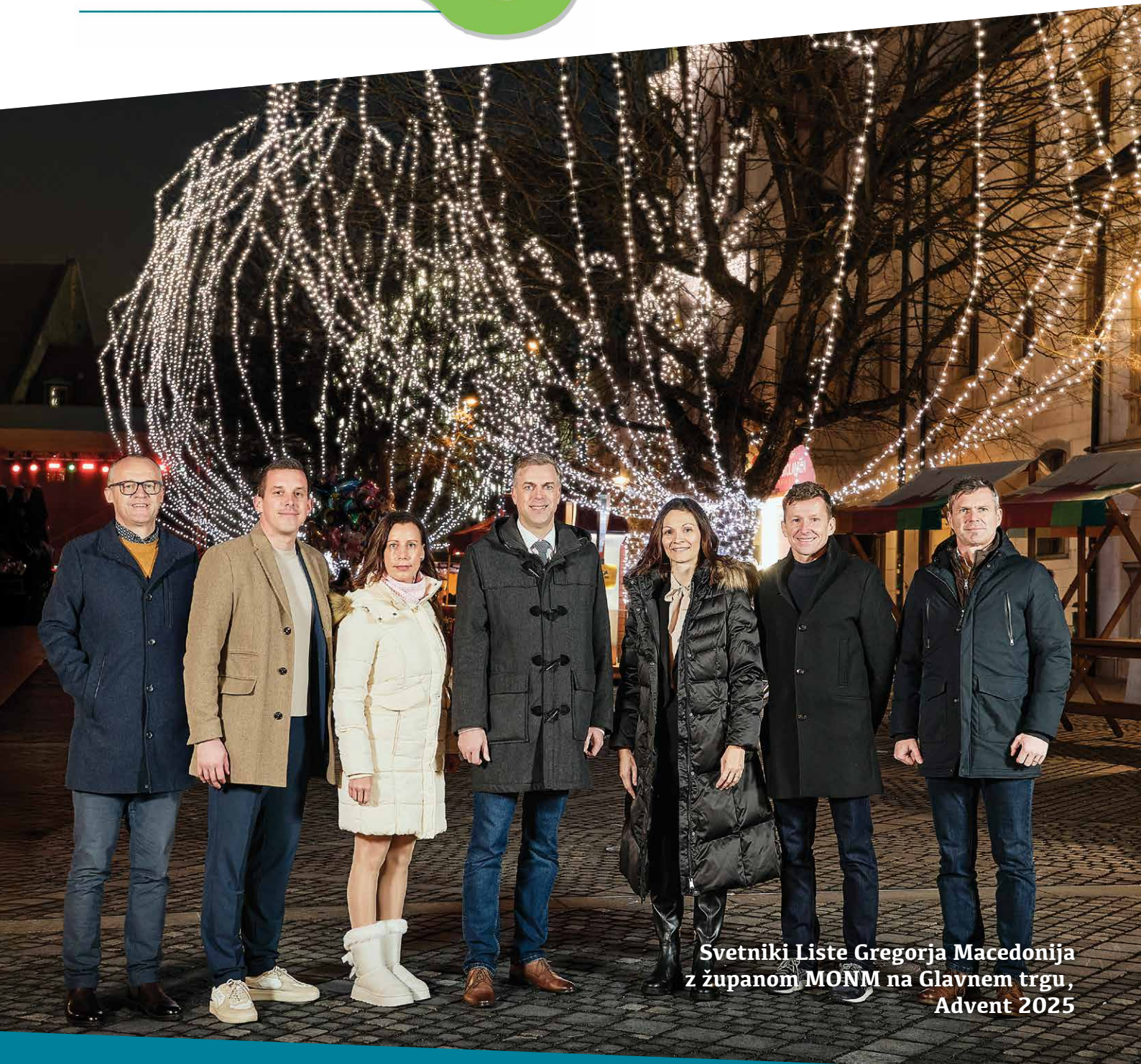
Svetniki Liste Gregorja Macedonija z županom MONM na Glavnem trgu, Advent 2025